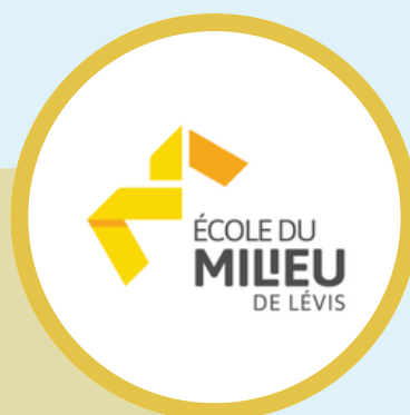
ÉCOLE DU MILIEU DE LÉVIS