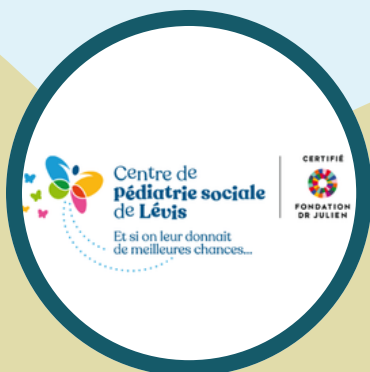
CENTRE DE PÉDIATRIE SOCIALE DE LÉVIS