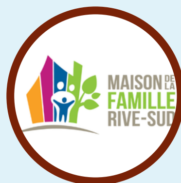
MAISON DE LA FAMILLE RIVE-SUD