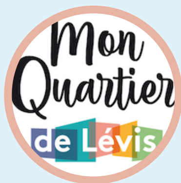
MON QUARTIER LÉVIS